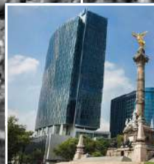
TORRE NEW YORK LIFE