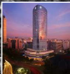
HOTEL ST. REGIS