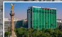
HOTEL SHERATON MARIA ISABEL