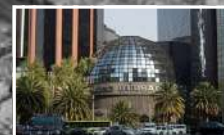
BOLSA MEXICANA DE VALORES