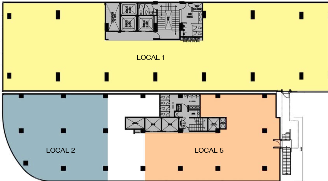
PLANTA NIVEL 1