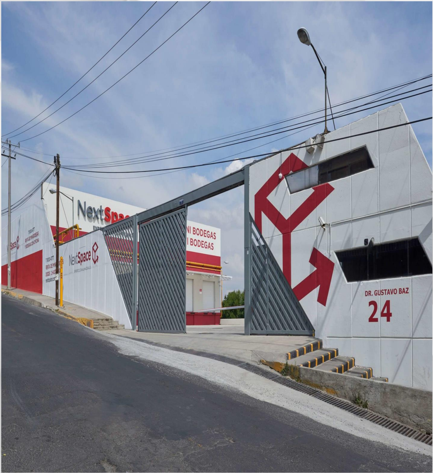
Dr. Gustavo Baz #24, México Nuevo. Atizapán de Zaragoza.